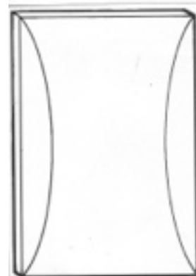
DIFFUSORPANEL TYP II