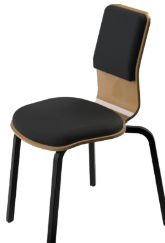
OPERA WOOD med stoppade insatsdynor i ryggstöd och sits.