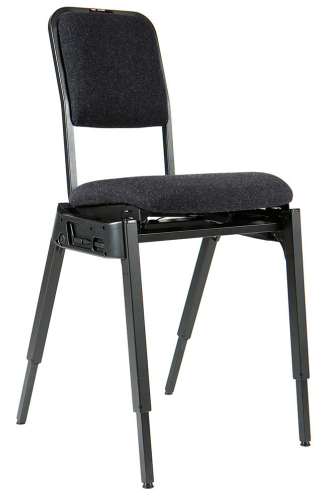
OPERA DIGITAL: Elektriskt inställbar sitsvinkel och manuell höjdjustering.