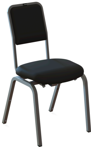
OPERA: All-round orkesterstol för konsert och repetition. Framåtlutande sits och extra smalt ryggstöd.