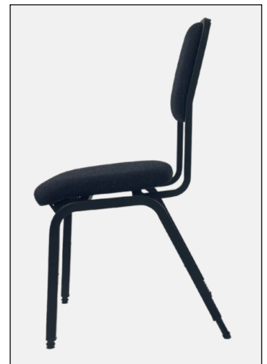
OPERA CELLO: Celistversionen av OPERA. Kraftigt framåtlutande sits och upprätt ryggstöd.