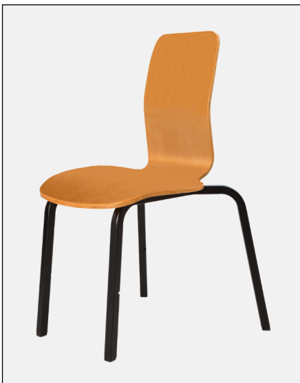
OPERA WOOD med sits och ryggstöd av trä.