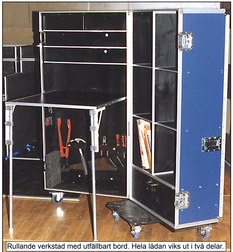
Rullande verkstad med utfällbart bord. Hela lådan viks ut i två delar.