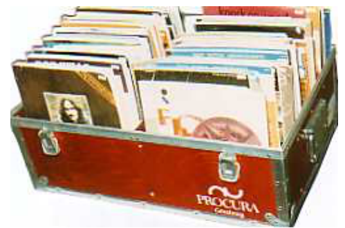
Mässlåda 9: För försäljning av böcker, noter etc. Packas i förväg. Väl på Mässan, lyfter man bara av locket.