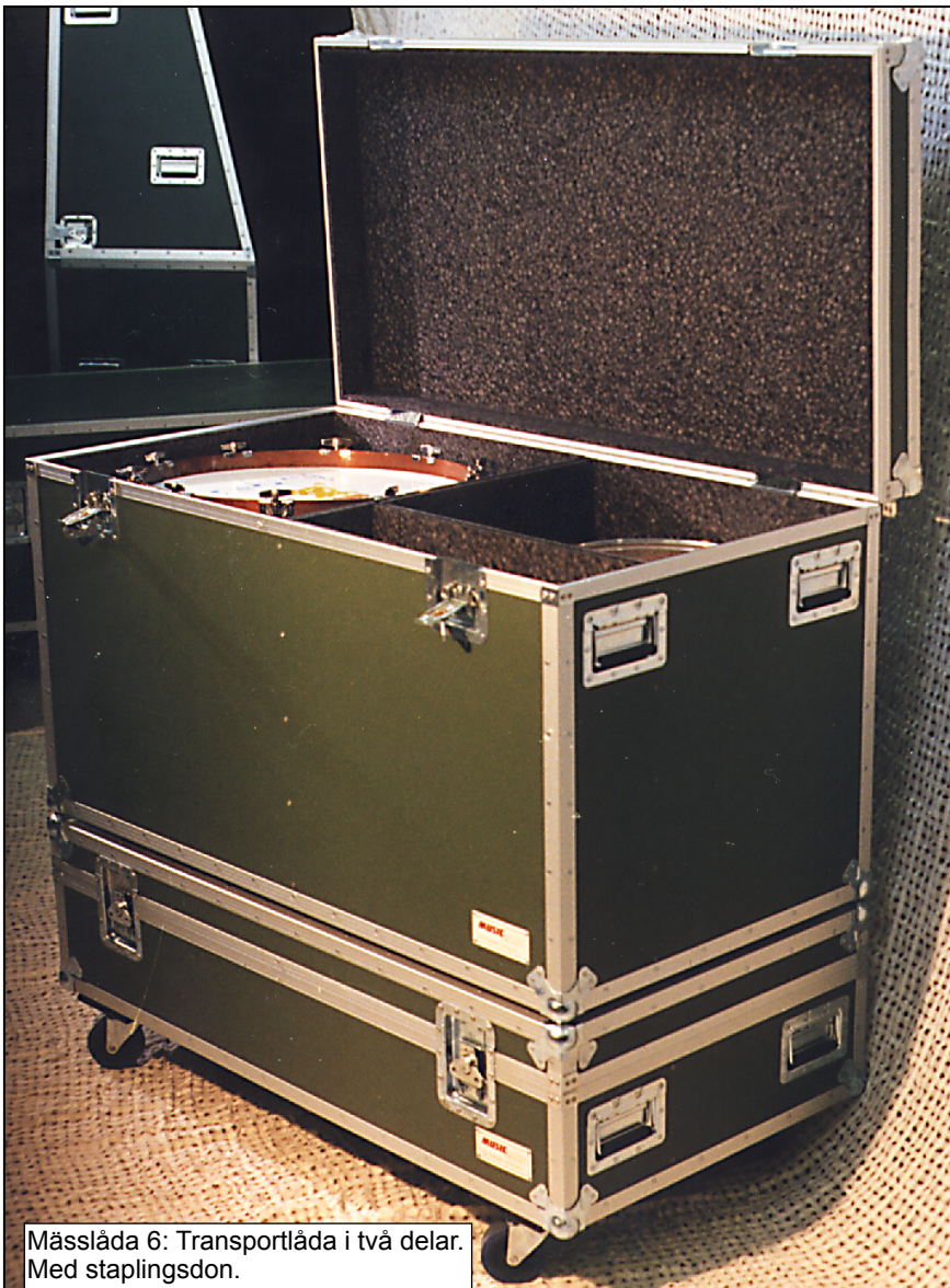
Mässlåda 6: Transportlåda i två delar. Med staplingsdon.