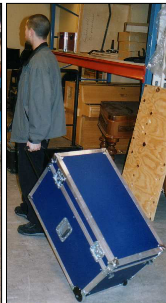
Mässlåda 7: Rullväska med infällbart draghandtag och inbyggda hjul. Hyllor eller utdragslådor..