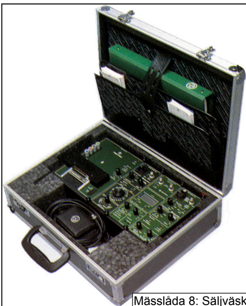
Mässlåda 8: Säljväska. Med kundanpassad inredning i skumplast (ovan) och facksystem (nedan).