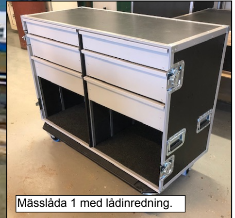
Mässlåda 1 med lådinredning.

Mässlåda 1: Den ena långsidan är avtagbar och blir ett bord genom de utfällbara benen. Casen och bordet kläds in med brandsäkert draperi i valfri färg.