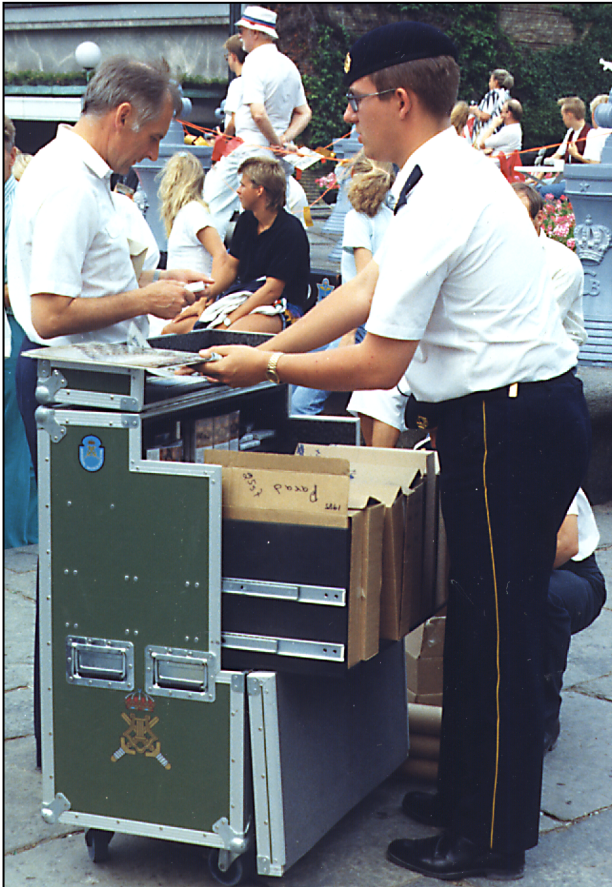
Mässlåda 2: Rullande försäljningsdisk. Uppfällbart lock, utdragslådor, lagerutrymme.