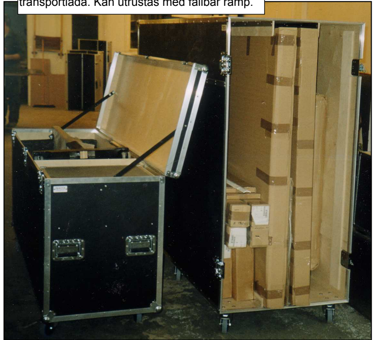
Mässlåda 4 t.v.: Toppmatad transportlåda med pallmått. Mässlåda 5 t.h.: Sidomatad transportlåda. Kan utrustas med fällbar ramp.