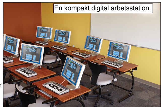
En kompakt digital arbetsstation.

Plats för grenuttag. Sladd-organisering med clips. Sladdgenomföring i arbetsskivan för enkel sladdåtkomlighet. Notställsbrätte av transparent akrylplast.