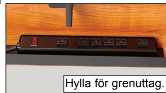
Hylla för grenuttag.