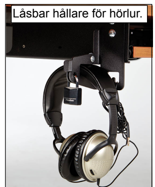
Läsbar hållare för hörlur.