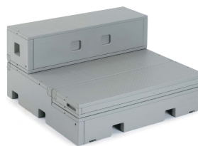
Läktre - sittande elever.