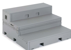
Gradäng - stående elever.