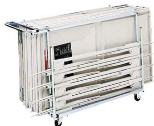
Vagn för Travelmaster.