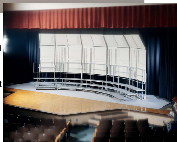
Travelmaster med Tourmaster körgrändanger