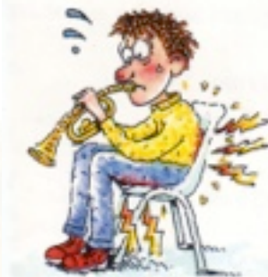
Vanlig stol: FEL SPELSTÄLLNING