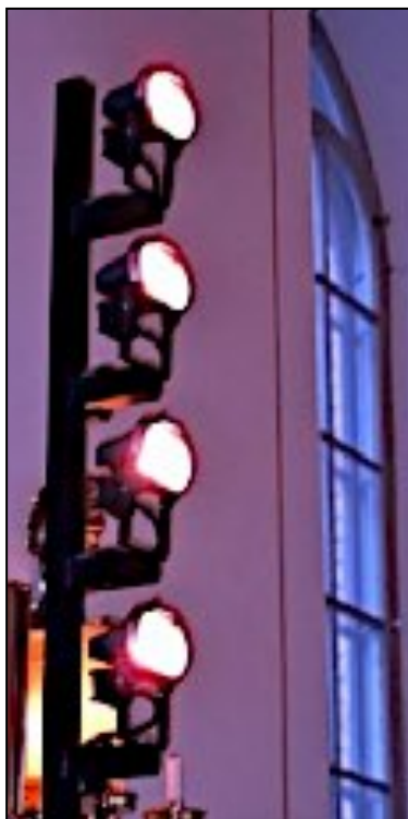
Körbelysningspelare. Med fjärrkontroll. Pris 2 st 10000:-/st. Nypris 14585:- /st.