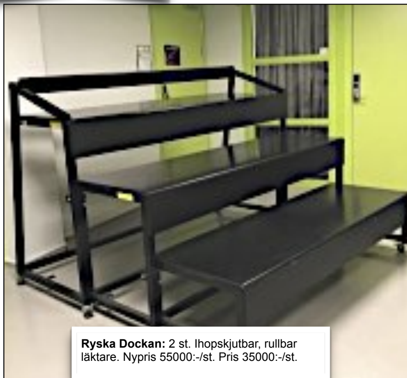
Ryska Dockan: 2 st. Ihopskjutbar, rullbar läktare. Nypris 55000:-/st. Pris 35000:-/st.

För detaljerad information - se vår hemsida under FYNDTORGET