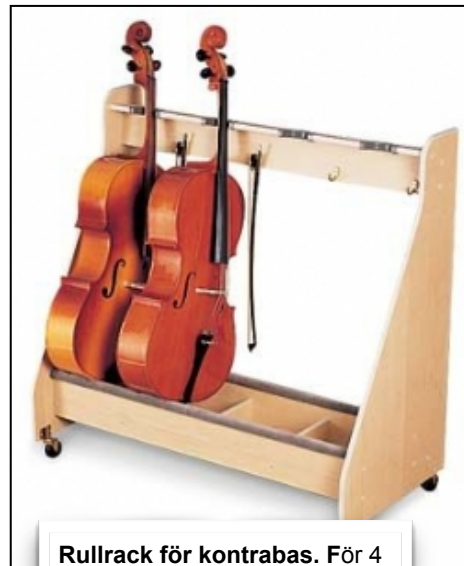
Rullrack för kontrabas. För 4 st instrument. Nypris 16477:-. Pris 11000:-