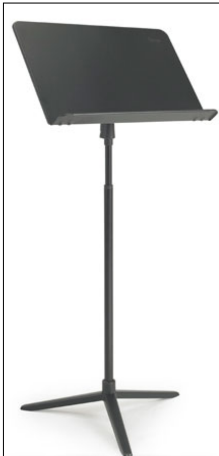
Notställ Wenger Roughneck. 5 st för 1000:-/st. Nypris 1435:-/st.

Praktisk utrustning för kultur, arena och evenemang sedan 1989.