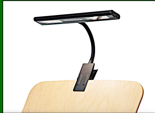
Trio4 LED Lights (RATstands). 3 st. Nypris 4900 :-/st. Pris 3900:-/st.