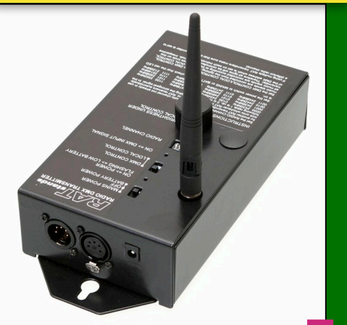
Radio Transmitter (RATstands). 3 st. Nypris 9677:-/st. Pris 6677:-/st