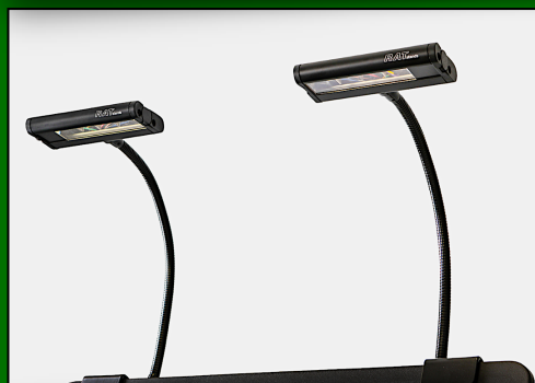
Trio4 TWIN HEAD dubbla not-lampor. (RATstands). Fäste med tumskruv. 1 st. Nypris 6988 :-/st. Pris 5988:-.