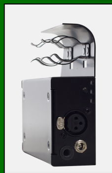
Batteri, Litium-jon för Trio4 LED-light (RATstands). 2 st. Nypris 3442:-. Pris 1442:-/st.

LAGERRENSNING: Passa på att köpa RATstands erkänt effektiva notbelysning för proffs och amatörer med kraftig rabatt.